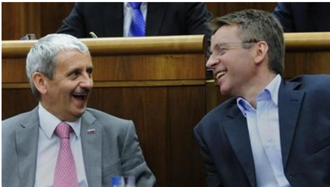
Dzurinda, Mikloš