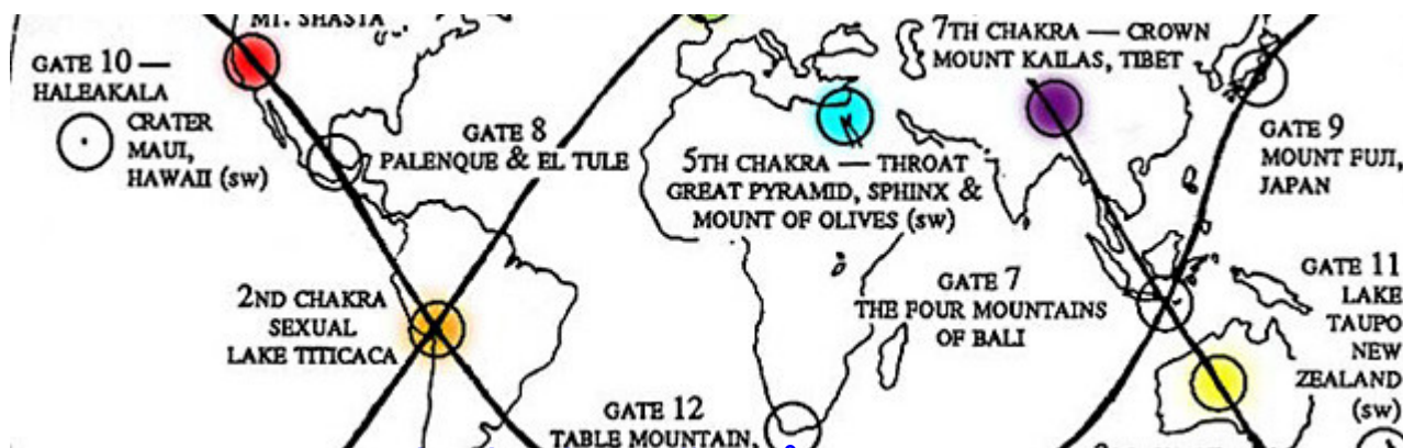
Geomantie a posvátná místa předků