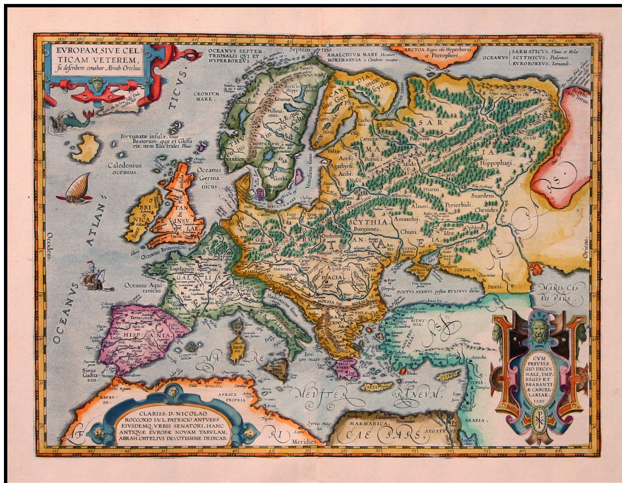
Mapa staroveké Evropy - Skýtie v 6.století n.l. (Abraham Ortelius. 1527-1598)

Prvé zmienky o Rusoch na juhu Ruskej roviny (Rosomoni Jordana - 4. storočie) sa objavujú presne v tom čase, keď miznú zmienky o Skýtoch. Stredovekí autori nazývali Rusov Skýtmi. A to - samozrejme - nie je žiadna náhoda. Skýti nikdy nezmizli, jednoducho sa začali nazývať Rusmi. Takže Rusi sú priami potomkovia Skýtov a následníci ich Slávy a skýtske dejiny sú súčasťou staroruských dejín. V prospech toho, že Skýti boli našimi Predkami hovorí aj „POVEŠŤ O SLOVIENOVÍ A MESTE SLOVIENSK“, v ktorej sa za Predkov ruského národa označujú kniežatá Slovieni a Rus, ktorí po dlhom putovaní založili mestá Sloviensk (neskoršie Novgorod) a Rusu (Stará Rus), a to ešte v 3. tisícročí pred n.l.