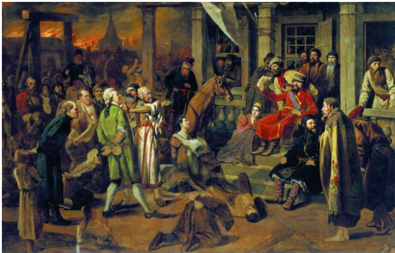
Pugačov soudí zajaté šlechtice (Vasilij Grigorjevič Pěrov, 1879)

Další etapou “horké fáze” nekončící války civilizací byla událost, kterou skromní vědci nazvali “Rolnické povstání Jemeljana Pugačova” . Nic nového v této situaci nevidíme. Stále jeden a tentýž scénář: znovu zloděj, jenom Lžipetr, znovu vandrák a zločinec a opět hloupí rolníci, kteří kvůli přirozené “živelnosti” povstání, sami nechápali proti čemu.