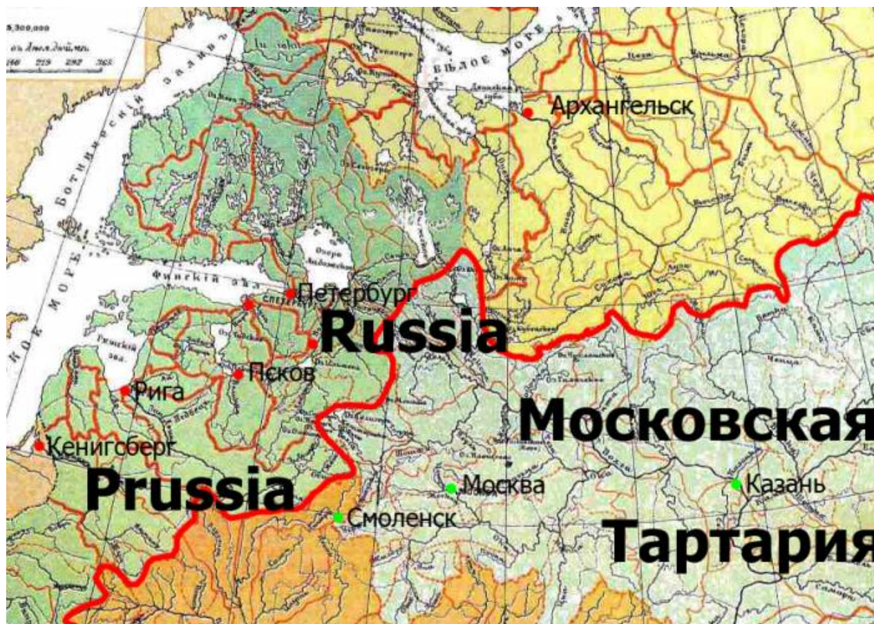
Fragmenty mapy Šokalského ze slovníku Brockhausu, kde červená čára naznačuje rozvodí řek Baltiku

Jinými slovy, nepotřebuji vynalézt nějakou novou realitu, vysvětlují jen, proč tyto oblasti bývaly různými státy, a že Petrohrad - tedy Oldenburgové/"Romanovci" - dobyli Moskevskou Tartárii a poté své nové majetky nazval Ruskou říší, což znamená, že rozšířil název Russia na dobyté země. V tom není nic urážlivého (nu možná pro ty, kteří se pokládají za potomky vládců Tartárie), naopak, v důsledku vznikl velice mocný stát, takže osobně nemám v této věci vůči dobyvatelům žádné výhrady.