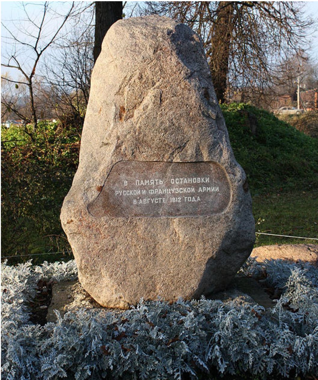
Pamětní kámen na místě zastávky ruské a francouzské armády. Statek Bolšoje Vjazjomy v Odincovském rajonu Moskevské oblasti