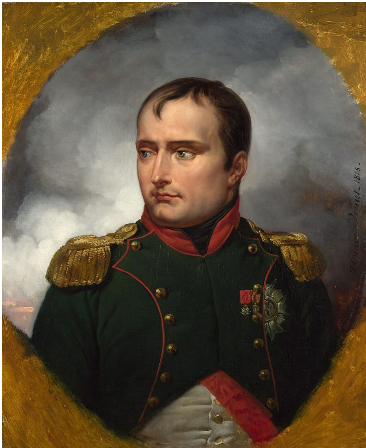
Napoleon I. Emil-Jean-Oras Vernet. Londýnská národní galerie

Ale všechno se vysvětlí, když si uvědomíte, že Francie nebyla nepřítelem Petrohradu, ale byla součástí Svaté říše římské, jejíž centrum se v osmnáctém století nacházelo právě na severozápadě Ruska. Tím se vysvětlují mnohé absurdity, napsané o této tajemné “Vlastenecké válce z roku 1812”. Francouzský expediční sbor byl jen částí armády Svaté říše římské, která působila společně s ruskou armádou proti Moskevské Tartárii.