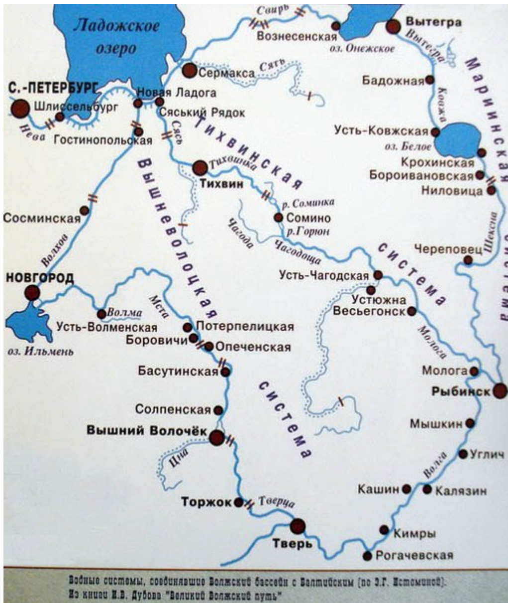
Vodní cesty z