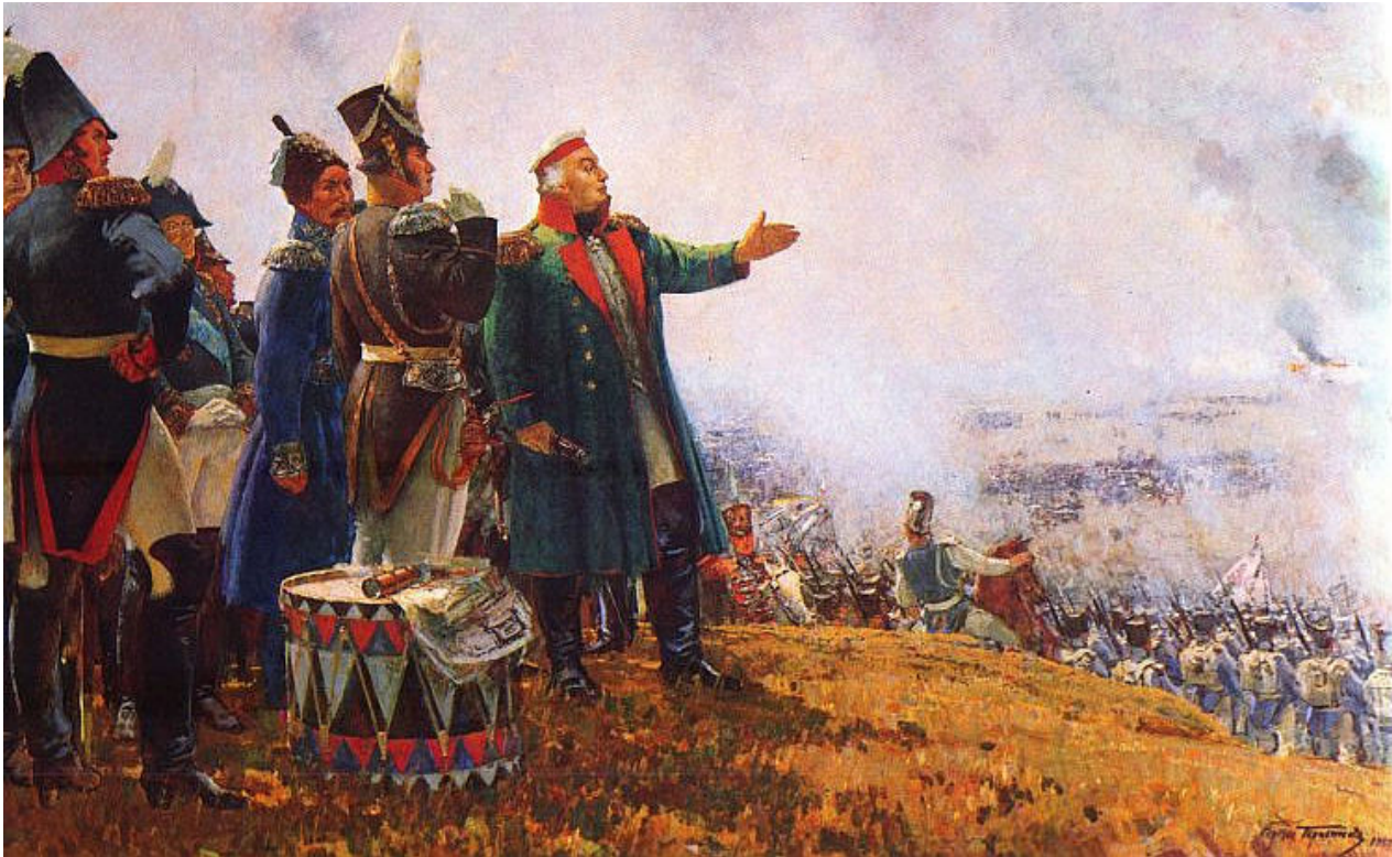
S. V. Gerasimov: Kutuzov u Borodina, 1952

Další válka mezi Tartárii a Evropou proběhla na počátku devatenáctého století. V naší zemi je známá jako “Vlastenecká válka z roku 1812” a v Evropě se jí říká “Napoleonova východní kampaň”. V tomto příběhu je všechno obráceně, názvy počínaje. Abychom to pochopili, musíme zvolit správnou definici pojmu “vlastenecká”. Lidé se vztahují k rodné řeči jako k souboru zvuků... Ve skutečnosti však ruský jazyk na rozdíl od většiny jazyků uměle vytvořených v nedávné minulosti neztratil svůj původní význam. Je to jako matrice, která prostě neumožňuje zkreslit realitu.