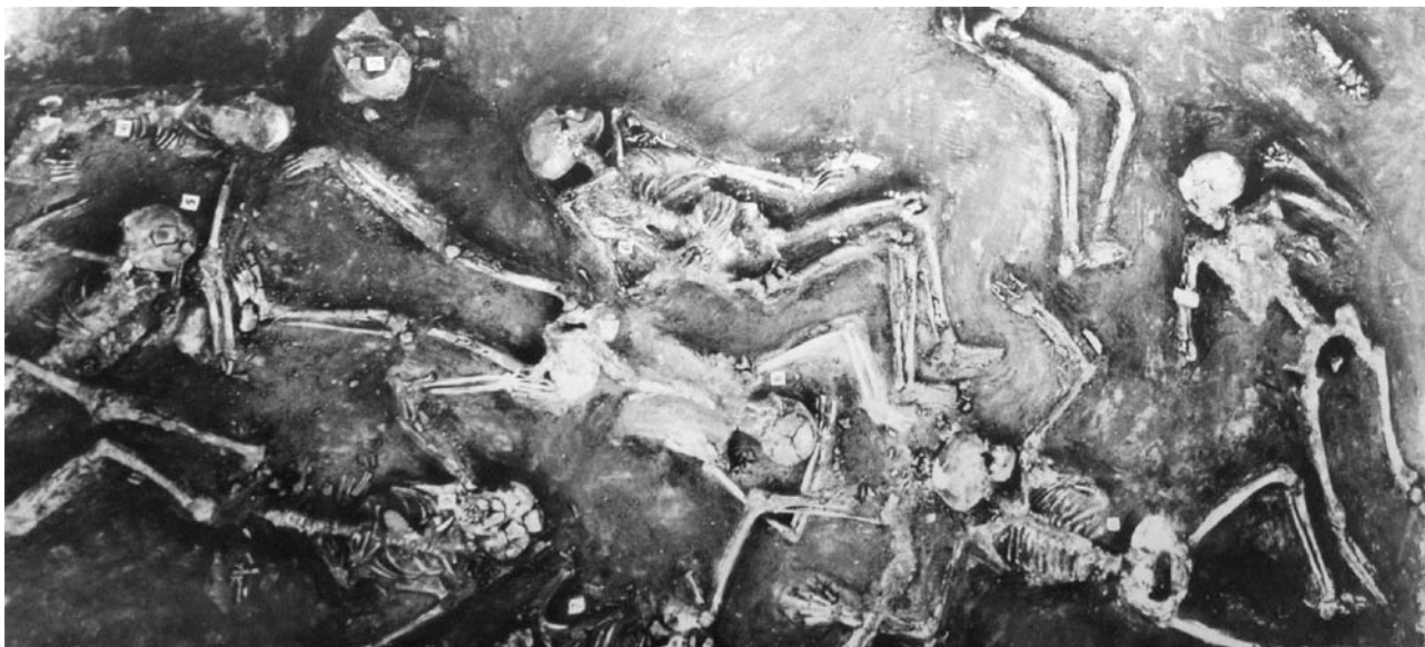
Kostry nalezené v Harappě, které měly 50krát vyšší radioaktivitu, než je běžné.

Tyto kostry patří k nejradioaktivnějším, jaké kdy byly nalezeny, a jsou srovnatelné s kostrami z Hirošimy a Nagasaki. Na jednom místě našli sovětští vědci kostru, jejíž radioaktivita byla padesátkrát vyšší než je norma. V severní Indii byla objevena další města, která vykazují známky explozí velkého rozsahu. Jedno takové město, nalezené mezi Gangou a pohořím Rádžmahal, bylo zřejmě vystaveno intenzivnímu silovému žáru. Obrovské masy zdí a základy domů starobylého města jsou srostlé, doslova zesklivatělé! A protože v Mohendžodáru ani v jiných městech neexistují žádné známky sopečného výbuchu, intenzivní žár, který by roztavil hliněné nádoby, lze vysvětlit pouze atomovým výbuchem nebo nějakou jinou neznámou zbraní. Města byla zcela vyhlazena.