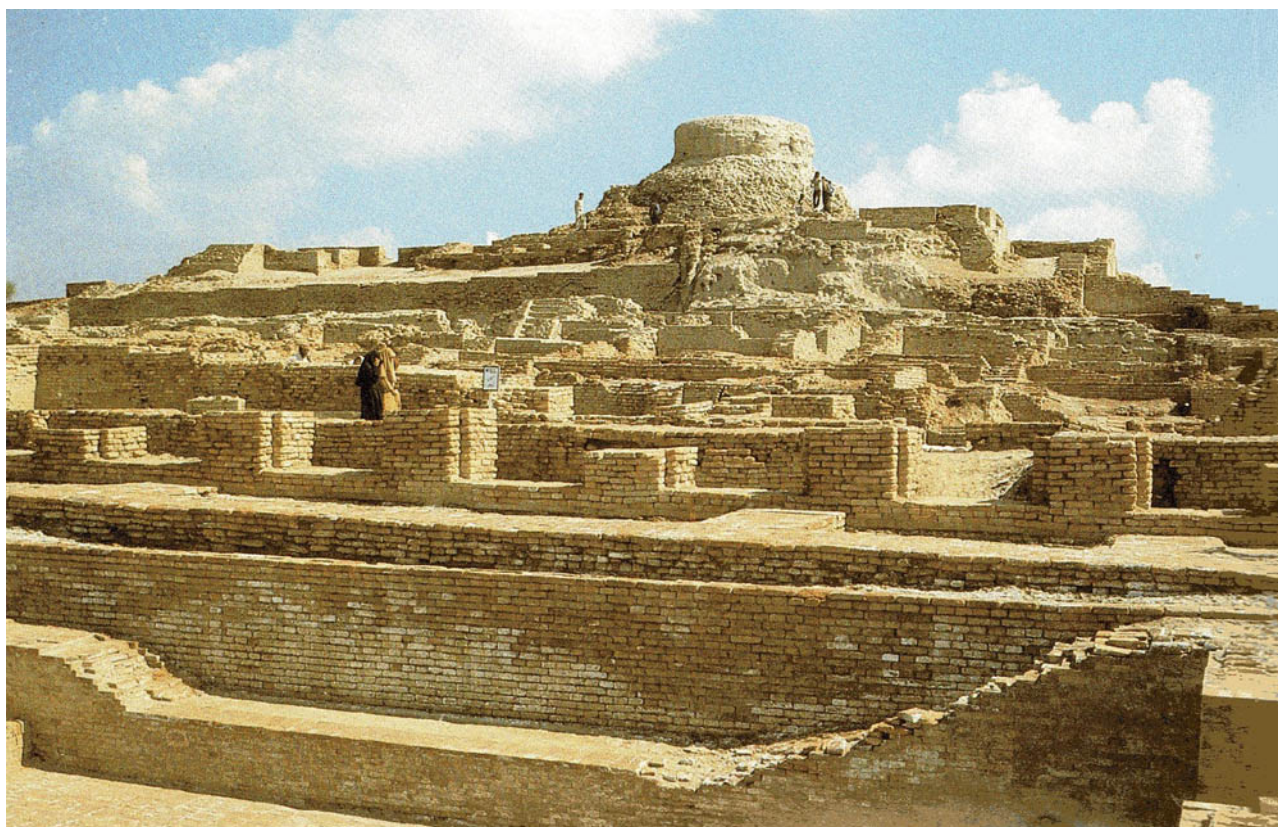
Harappa a Mohendžo-Daro

Až do bombardování Hirošimy a Nagasaki si moderní lidstvo nedokázalo představit žádnou tak strašnou a ničivou zbraň, jakou popisují staroindické texty. Přesto velmi přesně popisovaly účinky atomového výbuchu. Při otravě radioaktivitou padají vlasy i nehty. Ponoření do vody přináší určitou úlevu, i když není lékem.