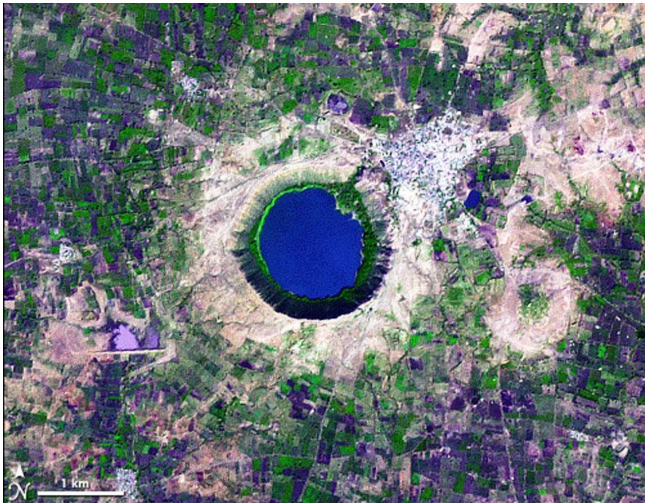
Kruhový kráter Lonar o průměru 2 154 m u Bombaje

Další zajímavou známkou dávné jaderné války v Indii je obří kráter poblíž Bombaje. Téměř kruhový kráter Lonar o průměru 2 154 m, který se nachází 400 km severovýchodně od Bombaje a jehož stáří je méně než 50 000 let, by mohl souviset s dávnou jadernou válkou. Na místě ani v okolí nebyly nalezeny žádné stopy po meteorickém materiálu apod. a jedná se o jediný známý „impaktní“ kráter v čediči na světě. Z místa lze zjistit známky velkého otřesu a intenzivního, náhlého žáru (na který poukazují kuličky čedičového skla).