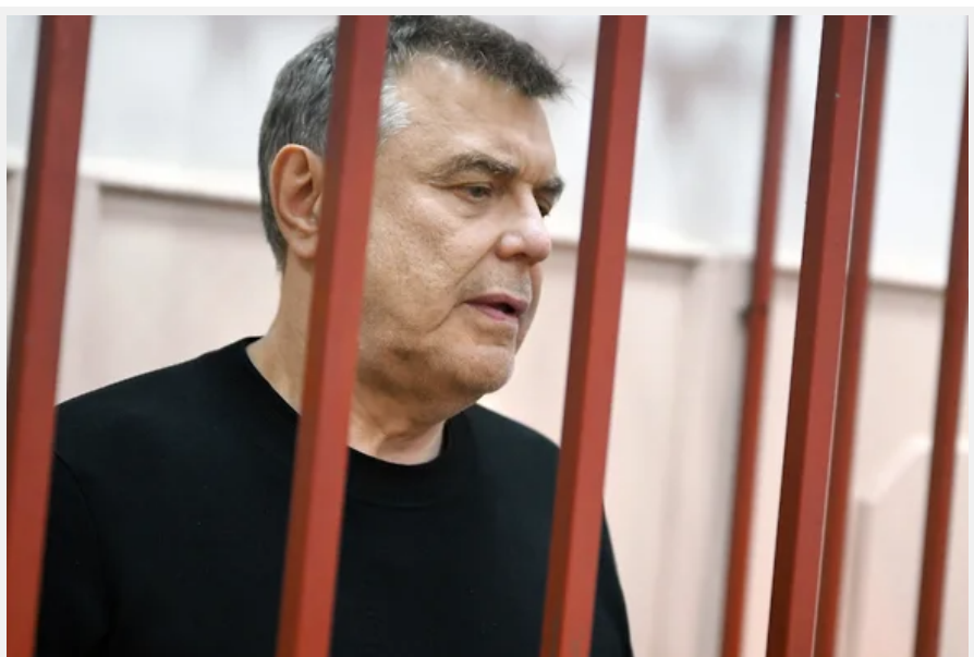
Sacharov za mřížemi

To znamená, že za 10 dní, včetně těch ze Stavropolu, bylo zatčeno přes 15 úředníků různých úrovní. Od regionálních ministrů až po vrcholové manažery státních korporací. Ačkoli Dmitrij Sergejevič Peskov řekl, že zadržování je běžná práce, která má stále velký rozsah, není to ani zdaleka „běžná práce“. Zkorumpovaní úředníci jsou vybíráni v dávkách a jsou vytahováni z dlouho zavedených klanových, blízkostátních skupin organizovaného zločinu, včetně těch nedotknutelných.