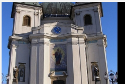
Hostýnská bazilika [3]

V poutní bazilice Nanebevzetí Panny Marie stojí nad hlavním oltářem socha Panny Marie v životní velikosti s Ježíškem, který metá blesky, určené Tatarům zobrazeným dole. Tito krutí nájezdníci na počátku 13. století ohrožovali Evropu a v roce 1241 vpadli také na Moravu, kde vraždili a drancovali. Lidé hledali pro sebe a svůj nejskromnější majetek útočiště v lesích a na horách.