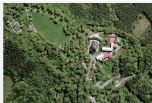
Hostýn - letecký pohled [5]

Hradisko je po obvodu opevněno valem vysokým většinou kolem 4 metrů, v jihozápadní části však dosahuje výšky až 8 metrů; před ním se nachází příkop. V jihozápadní části je toto opevnění přerušeno původním hlavním vchodem, tzv.