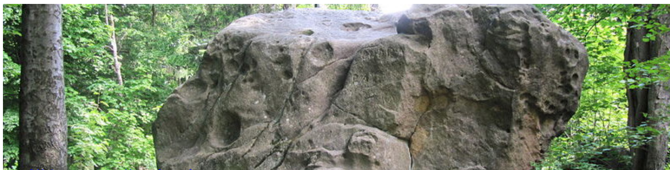
Kláštov - obětní místo boha Peruna